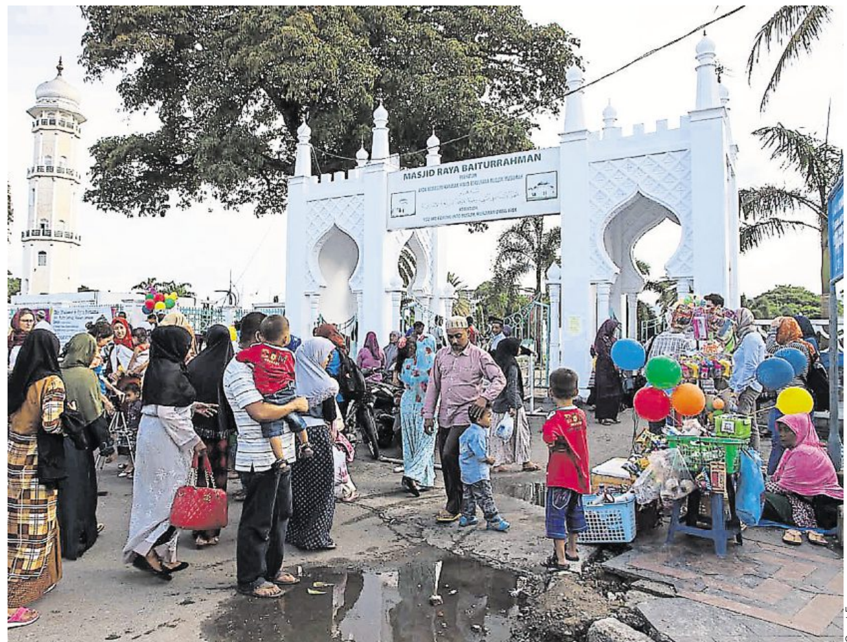
Le cœur de la ville, où la vie bat à la sortie de la prière de l'après-midi, c'est la grande mosquée Baiturrahman.