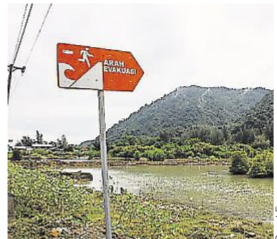
Un panneau indiquant une aire d'évacuation près de Banda Aceh.

Lors du tsunami de 2004, il n'existait aucun système d'alerte dans l'océan Indien. En 2013, Australie, Indonésie et Inde ont déployé l'Indian Ocean Tsunami Warning System, qui déclenche l'alarme aux vagues submergées en cas de fort séisme. Les États-Unis ont musclé leurs équipes de veille à Hawaï et en Alaska pour le Pacifique. Les pays riverains réfléchissent à un dispositif en Méditerranée. « Avant 2004, on comptait une centaine de scientifiques dans le monde travaillant sur les tsunamis. Ils sont aujourd'hui un millier », souligne l'expert américain Eddie Bernard. Le nombre des bouées mesurant la pression au fond des océans, et informant en temps réel, a décuplé.