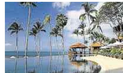
La piscine de l'hôtel Napasai.

Un bon plan sous le soleil de la Thaïlande. Les hôtels Orient Express