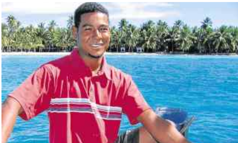
Des plages de rêve et un accueil chaleureux.

Nature. La moitié du territoire naturel est protégé. La République dominicaine a sa cordillère, avec le pic Duarte, le plus haut des Caraïbes (3 087 mètres). Les montagnes sont propices au rafting, aux randos en VTT. À découvrir, dans le nord, la presqu'île de Samana et le parc national Los Haïtises, pour ses mangroves