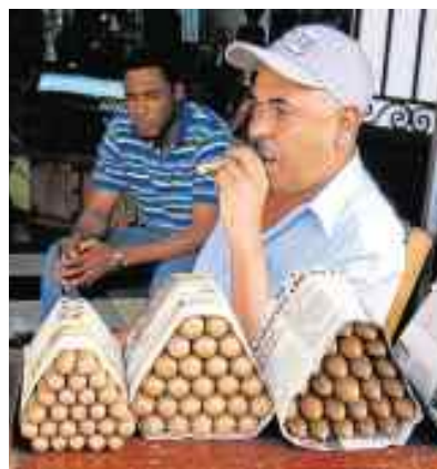
Cigares à Saint-Domingue.