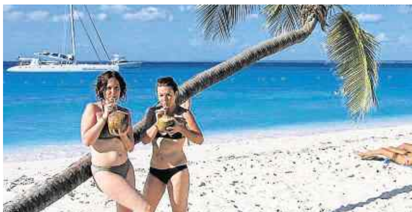
Farniente à l'île de Saona.